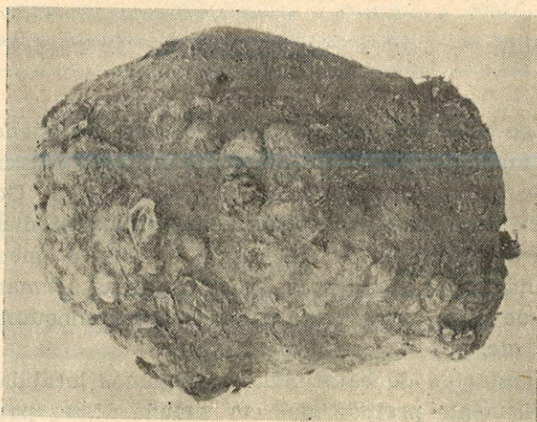
Fig. 1 — Tubérculos de batatinha com péssimo aspeto exterior, devido infestação de nematóides

Por informações do Engo. Agro. Reinaldo Foster, solicitámos e recebemos em 1946, da firma norte-americana "The